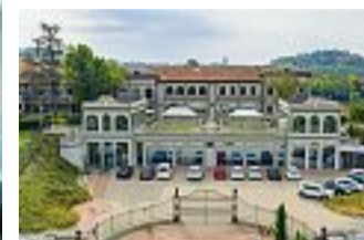
Alta gamma Sopra la sede di Vpa Valmadonna (Alessandria) presso l'antica «Villa Pedemonte».